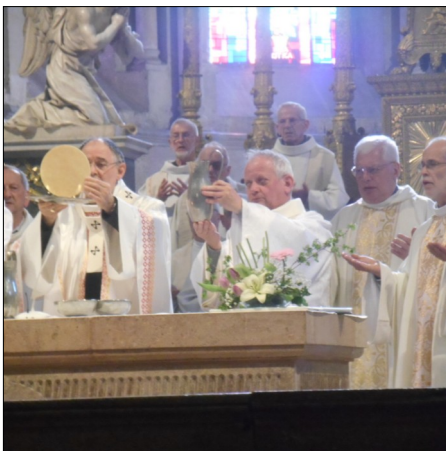
MESSE D'ORDINATION LE 12 AVRIL 2015, CATHÉDRALE ST. JEAN DE BESANÇON